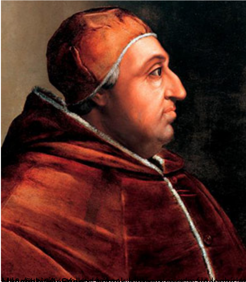
... több más együttesét a Rodrigo Borgia ,

Mátyás és Beatrix Synastria Beatrix 1475. november 16 Nápoly, Olaszország (Beatrix bolygói a körön kívül)